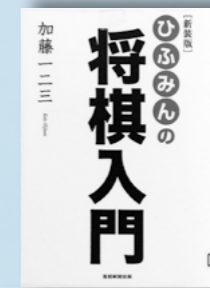
ひふみんの将棋入門