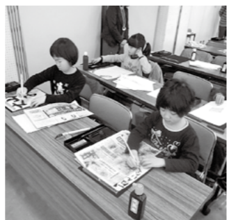
書き初めに集中する児童

●問 II メディアセンター ☎(64)0919、〒899-1439 国分中央3-145