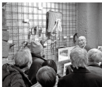
講師から採掘道具の説明を受ける参加者