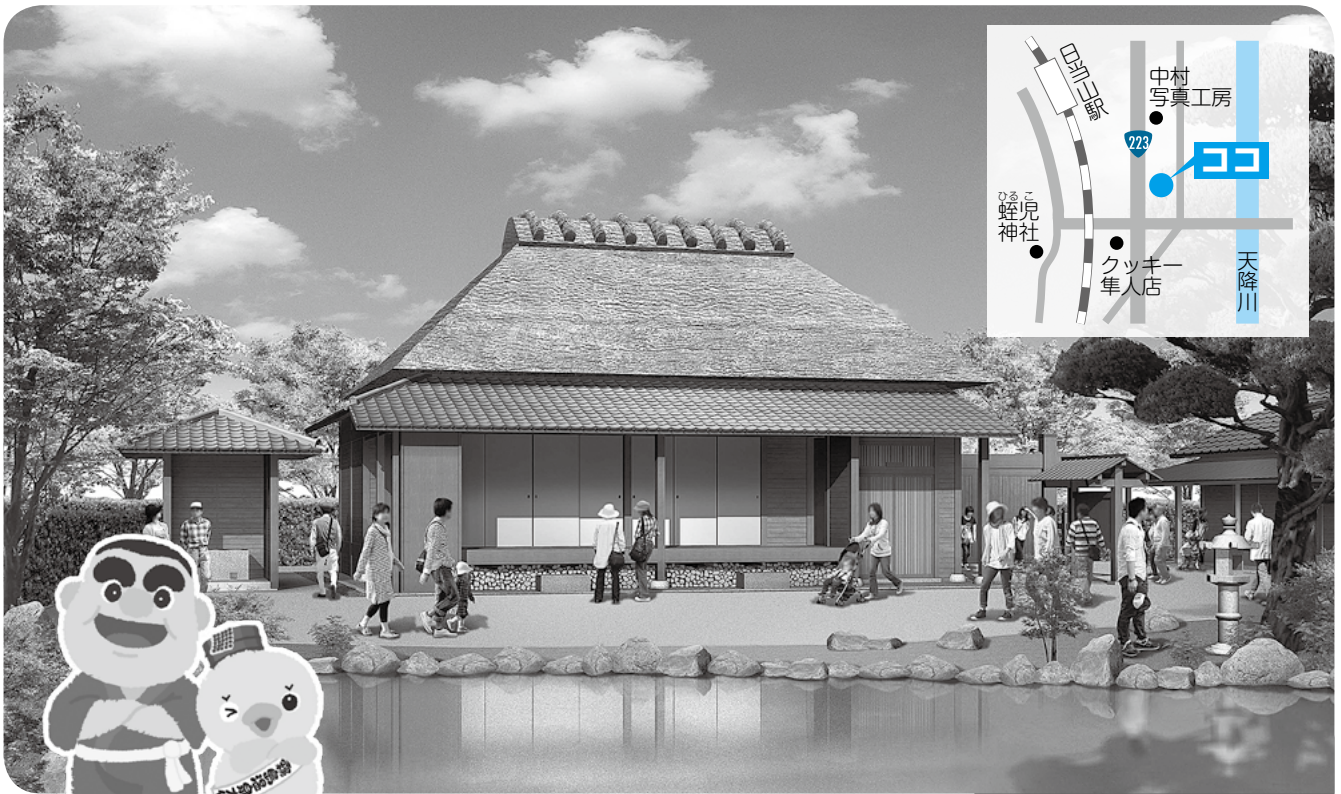
西郷どんの宿の完成予想図