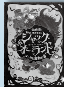
ジャック・オランダ