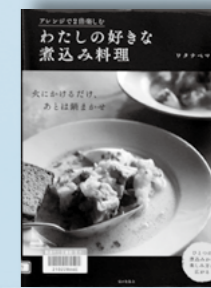
わたしの好きな煮込み料理