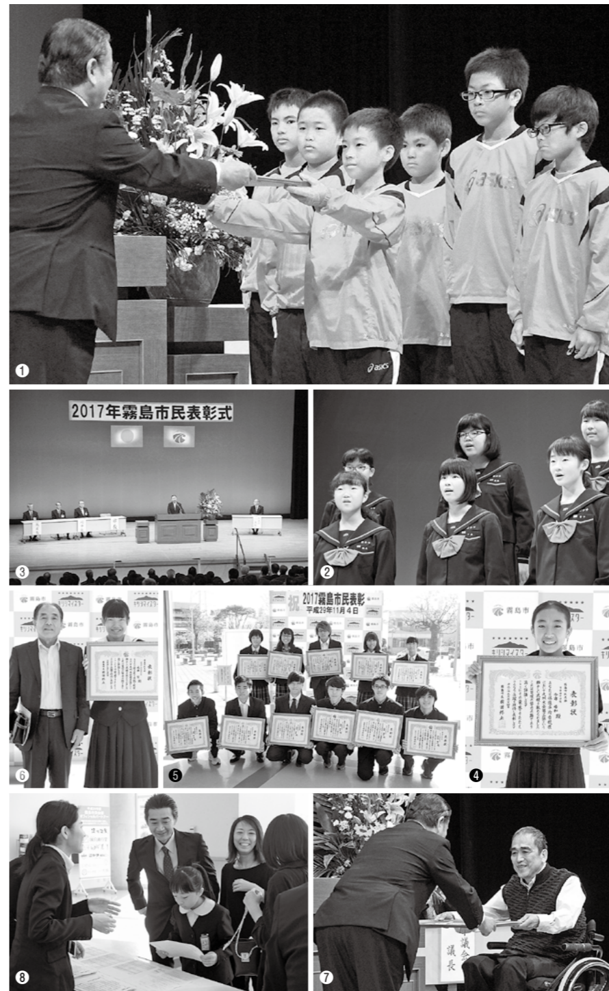
①1人1人功績を読み上げられ、表彰状を受け取る受賞者 ②伸びやかな合唱でオープニングを飾った国分中学校合唱部 ③式典の様子 ④⑤⑥キラシマイスターボードと一緒に記念撮影 ⑦受賞に笑顔がこぼれる ⑧子どもの受賞を喜ぶ保護者