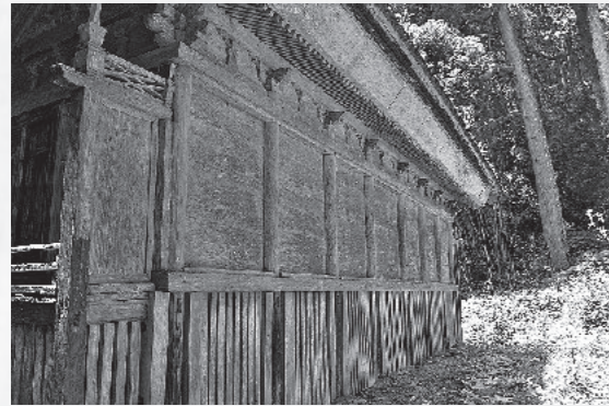
本殿の裏側。7間造りであることが分かる

神社に残る由来書「日枝神社明細書」によると、日枝神社社殿は建仁三(一一二二)年、