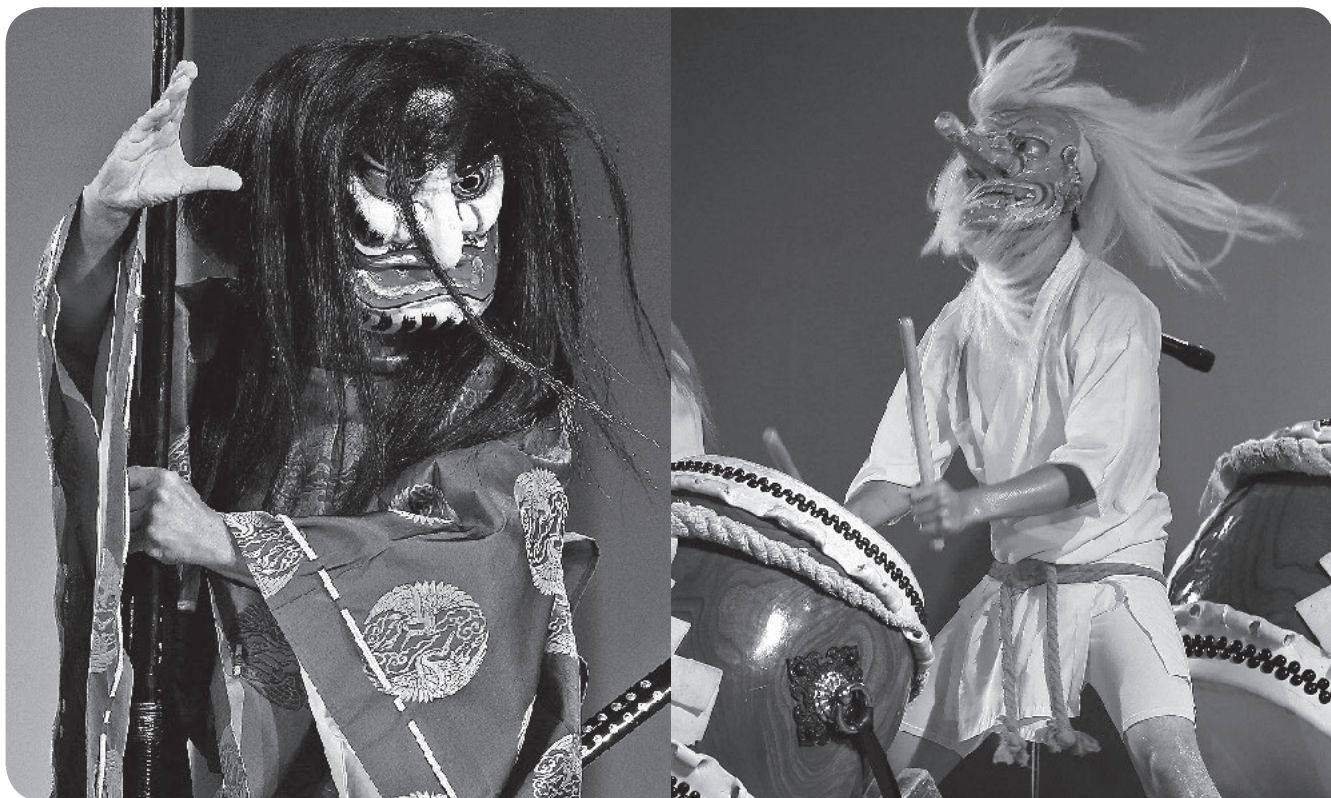
【左】地域に伝わる神楽を披露(南九州神楽まつり) 【右】迫力ある太鼓演奏(霧島高原太鼓まつり)