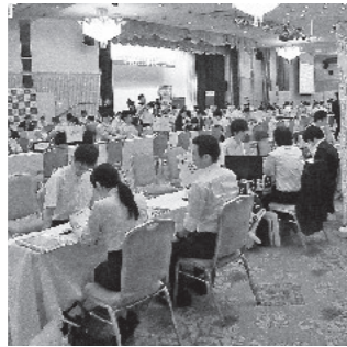
昨年同様の合同面接会の様子

鹿児島県の優良企業100社が参加する面接会です。一度に多くの企業と出会う絶好のチャンスです。 ●日時 8月10日(木)午後1時～5時 ●場所 鹿児島サンロイヤルホテル(鹿児島市与次郎一丁目8-10) ●対象 UIターン希望者と県内への就職希望者