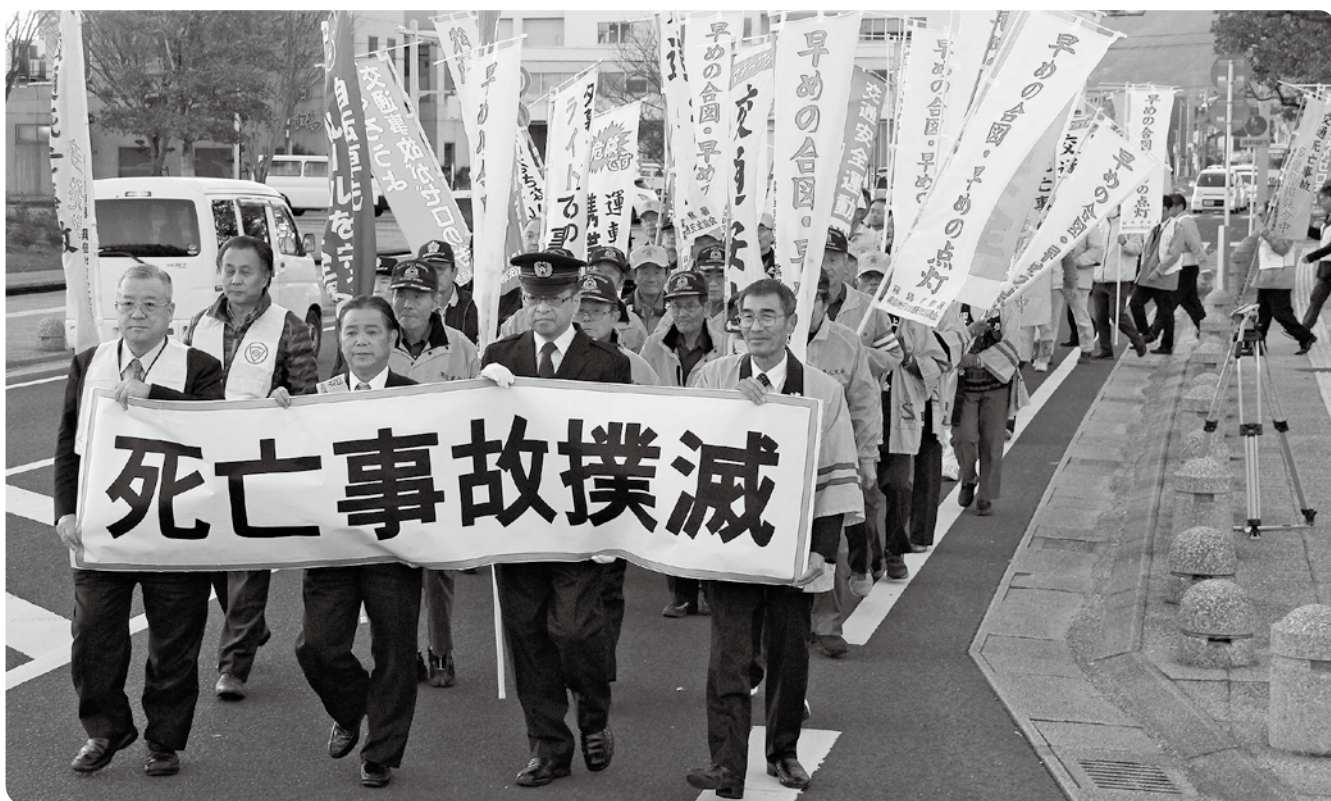
市役所前で12月8日にあった300人による交通死亡事故撲滅パレード