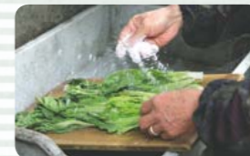
塩を満遍なくタカナに振りかける

【作り方】 ① タカナを洗って約1日(晴天の場合)干す。目安は耳たぶ程度の柔らかさになるまで。 ② 干したタカナに塩を満遍なく振り、もみ込む。 ③ パケツに②を入れ、水を少し入れて重しをする。 ④ 1日置くと完成。