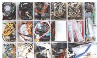
いろいろなサイズのねじや部品を常備し、修理に備える

て、少年の傑作は親に見つかり、元のラジオに戻りましたが、小さな部品が複雑に組み合せて物を作り上げるという奇跡は少年の心に大きな感動を与えました。