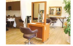
店内は落ち着いた雰囲気統一されている