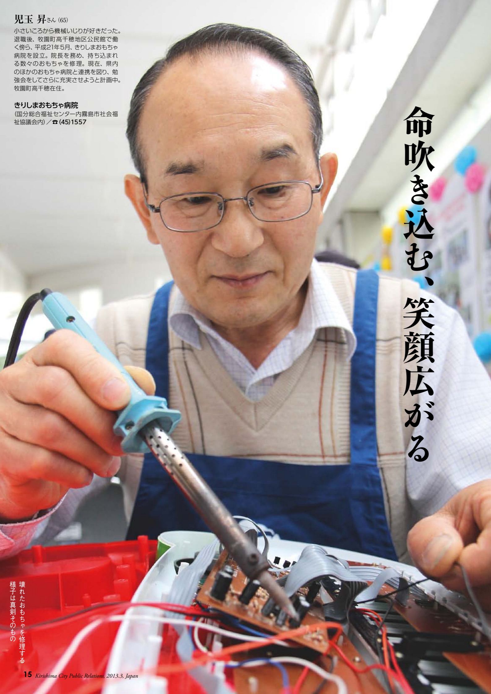
壊れたおもちゃを修理する様子は真剣そのもの