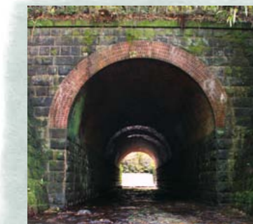
瀬久谷川暗渠(W=4.58m、L=38.6m)湧水町般若寺地区

肥薩線の世界遺産登録プロジェクト本格始動 「肥薩線を未来へつなぐ協議会」(湧水町、宮崎県えびの市、熊本県人吉市を発起人として14市町村で構成)は、昨年4月、人吉市役所内に肥薩線世界遺産推進室を設置。肥薩線を世界遺産に登録するための鉄道関連施設の調査や蒸気機関車D51の復活運行に向けた取り組みなど、一大プロジェクトが本格的に始動しました。