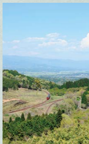
大畑駅のスイッチバック構造の線路

に全線開通。険しい地形を克服するために数多くのトンネルや橋、暗渠が建設され、日本初となるループ線とスイッチバックを併用した線路が敷設されるなど、当時のわが国で最高の鉄道、土木技術を駆使して建造されました。現在も数多くの鉄道関連施設が建設当時の姿で利用されていることから、鉄道史の中でも歴史的、文化的に貴重な遺産です。