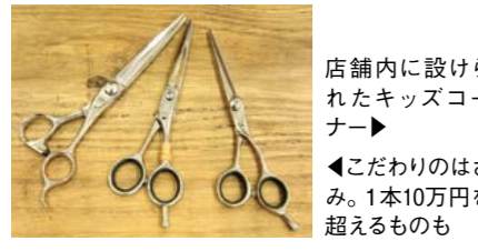
店舗内に設けられたキッズコーナー ◀こだわりのはさみ。1本10万円を超えるものも