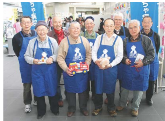
きりしまおもちゃ病院のドクターたち

「先日、年配の方が、かなり古いおもちゃを持って来られました。自分と子ども、孫まで親子三代で使っているという車のおもちゃでした。きつとたくさんの思い出が詰まっているでしょう。代用品の部品で修理してお渡ししたとき、本当に喜んでくれました。おもちゃ病院は私たちにとって大切な場所です。仲間と語り、壊れたおもちゃ