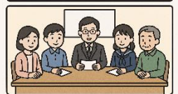
コミュニティ・スクール