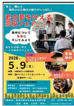
5月おすすめの 校外行事