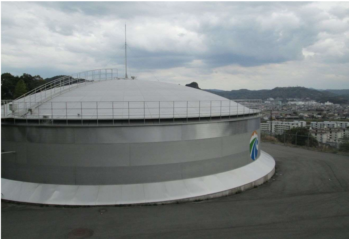
隼人木之房配水池