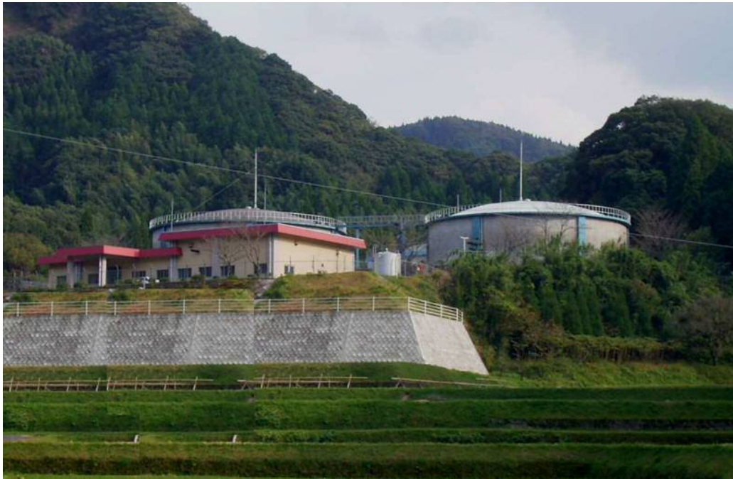
国分台明寺配水池