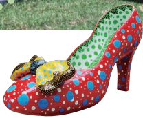
▲長さ4.3m、高さ2.5mもある大作 「赤い靴」(草間彌生/2002年制作)