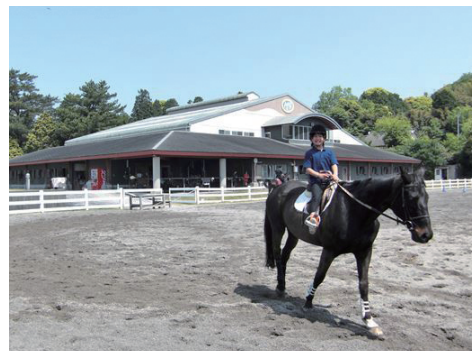
▲霧島高原の爽やかな風を感じながら乗馬を楽しもう