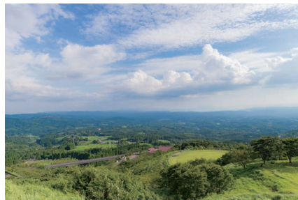
▲展望所からの雄大な景色は必見