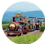
▲駐車場から中腹のクラブハウスまで運んでくれるロードトレイン・ポッポ号