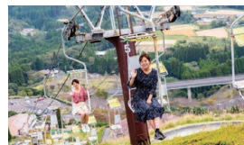
▲遊覧リフトとスーパースライダーは不動の人気