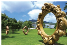
▲インスタ映えバツグン！ 「あなたこそアート」 (チェ・ジョンファ/2000年制作)