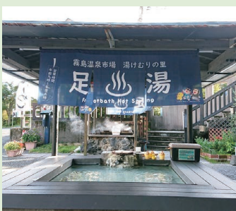
▲足湯は有料 (100 円) でタオル付。特に週末は多くの観光客で賑わう