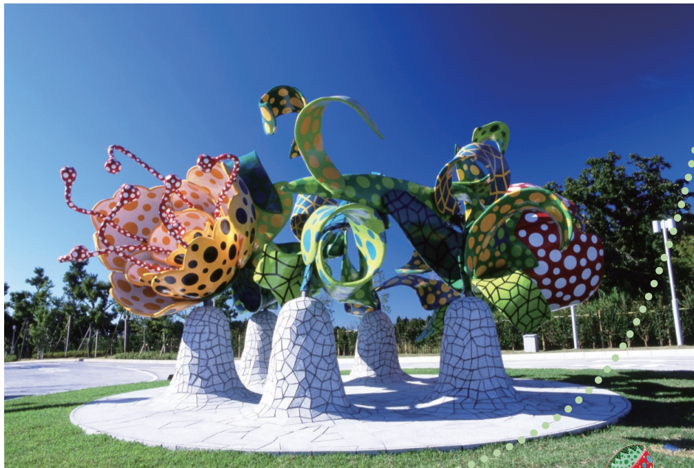
▲メインゲートで出迎える「シャングリラの華」(草間彌生/2000年制作)