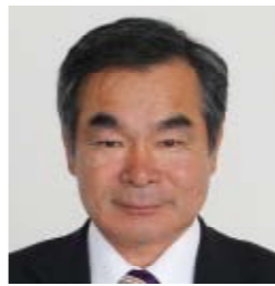
有村 隆志 議員

学校給食について 解体を行う22戸の計38戸で、約2800万円を見込んでいる。入居前のリフォームについては、撤去後、傷んだ箇所の修理を行い、入居決定時にクリーニング等を行っている。