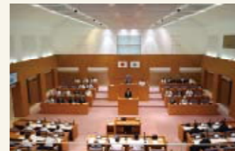
傍聴席から見た議場

12月定例会は、11月25日(火)に開会予定です。傍聴の手続は、議会棟4階にて「傍聴人受付簿」に住所と名前を書くだけです。お気軽にお越しください。ご不明な点は、議会事務局(64-0922)にお問い合わせください。