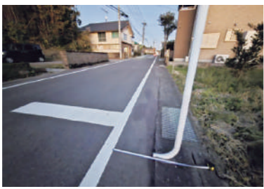
歩道設置の要望がある市道

問 市道東牧之原線（分遣所前）、牧之原十文字線（福山総合支所前）の歩道を整備する考えはないか。