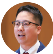
植山 太介 議員