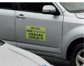
有償運送事業で使われている自家用車

※公共空白地有償運送事業とは バスやタクシーといった公共交通機関が十分に利用できない地域で、地域住民や自治体が主体となり、有償で人を運ぶ仕組み。