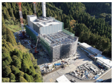
建設中の（仮称）霧島市クリーンセンター

答 環境衛生指導員を任用し、環境パトロールや啓発用看板の設置、不法投棄されたごみの回収を行っているほか、市内全域に環境美化推進員を69人配置し、環境パトロールなどを実施。また広報誌や市ホームページなどを活用して、不法投棄防止に関する啓発を行っている。