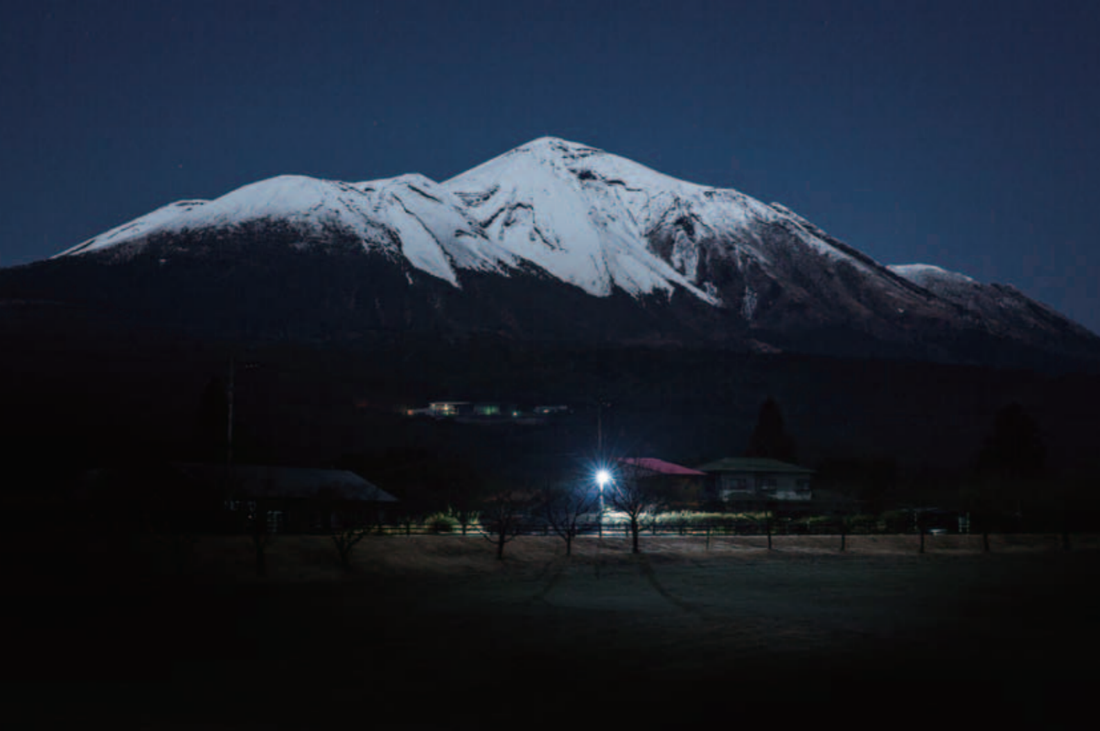
第15回きりしまフォトコンテスト【四季賞】浮かぶ霧島山