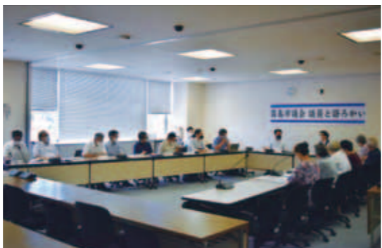
団体公募型の開催風景