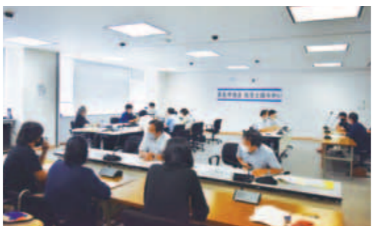
個人参加テーマ型の開催風景