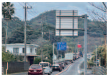
国道10号線小浜付近の渋滞

問 国道10号（小浜〜始良市境）ラッシュ時の渋滞緩和策として隼人道路を活用し、時間・区間を区切り、無料化や割引対象とする案はどうか。