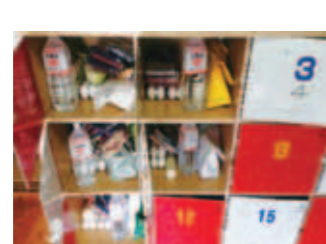
フードバンクの食材配布の一例