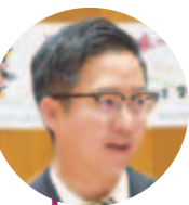
植山 太介 議員