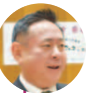
藤田 直仁 議員

問 新型コロナウイルス感染症の拡大により、影響を受け続けている宿泊施設などの観光業全般に対するこれまでの対応と、今後の展望についてどのように考えているか。