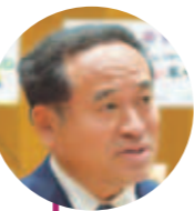
竹下 智行 議員