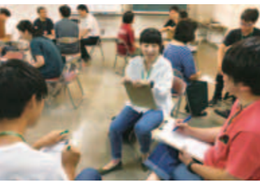
「横川未来研究室」講座の様子

答 1年目は、市内全域から参加者を募集し、それぞれの地域で感じている身近な課題解決のためのアクションプラン作成と、それらを実践に移す取組を行った。2年目・3年目は、横川地区を舞台に、地域が持つ魅力や資源を生かし、課題解決や理想の未来像を示すアクションプラン「横川未来計画」を作成し、参加者それぞれが主体的に活動し、自走できる体制づくりができた。