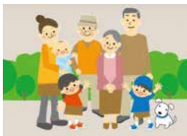
住み慣れたまちで安心して暮らせる地域づくり

答 国は「包括的な支援体制の整備」を示しており、本市でも高齢者・障がい者・児童等に関する相談支援窓口の集約について検討会や視察を重ねている。「配偶者暴力相談支援センター」の必要性は感じている。引き続き検討していく。