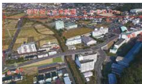
整備が進められる新町線

答 新町線に接続する街路山崎線を施工しており、向花五差路の渋滞解消が図られると考えている。