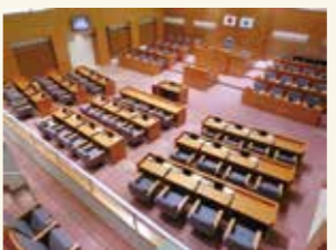
6月定例会は、延べ103人 の方が傍聴されました。