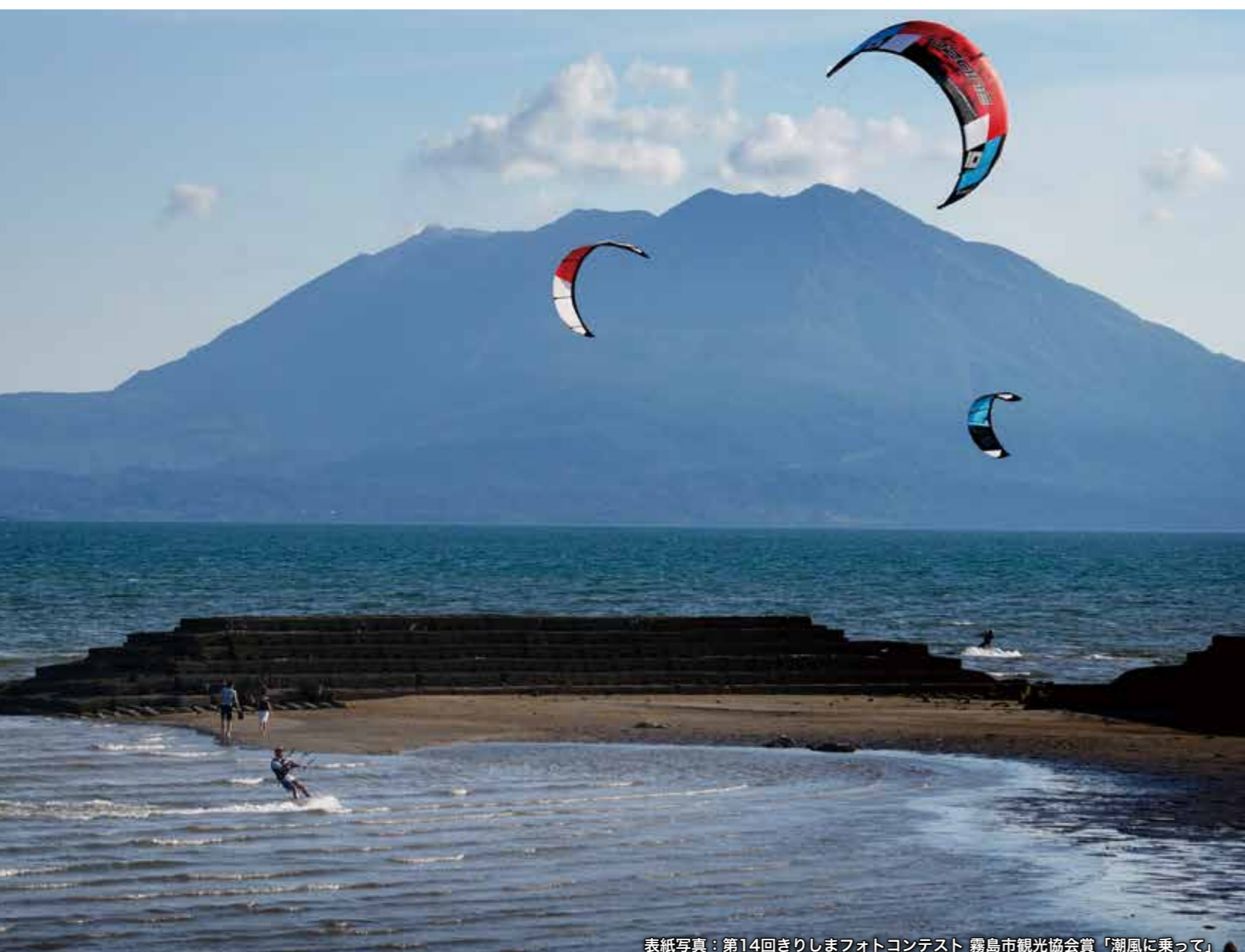
表紙写真：第14回きりしまフォトコンテスト 霧島市観光協会賞「潮風に乗って」