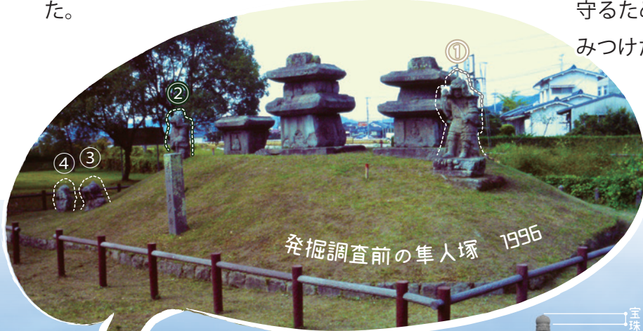
発掘調査前の隼人塚 1996

石塔それぞれの四面には様々な姿の仏が刻まれ、仏の世界が表されています。それを邪悪なものから守るために、鎧に身を包み、武器を持って邪鬼を踏みつけた四天王像が守ります。