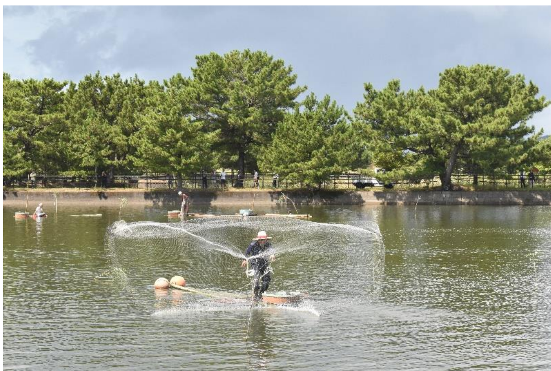
令和4年度のハンギリ出しの様子