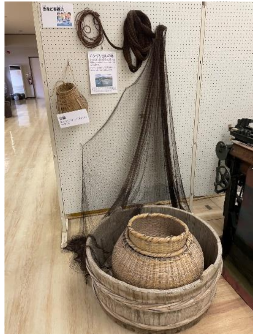
国分郷土館所蔵のハンギリと網