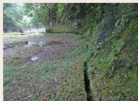
川床に用水路跡が残る