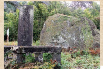
台明寺の石碑と腰掛岩

和15（1940）年には、日本全国で神話や皇室をたたえる記念事業が行われました。天孫降臨などさまざまな神話が伝わる本市でも、多くの事業が行われました。特に国分・福