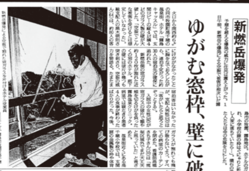
空振猛威「想定外」。霧島市。