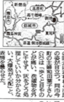
鹿空港の飛行ルート変更の様子。霧島市。

鹿空港 飛行ルート変更 鹿空港は、噴火の影響で、飛行機の飛行ルートが変更されている。飛行機の飛行ルートが変更されている。飛行機の飛行ルートが変更されている。