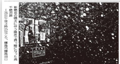
新燃岳の噴火による灰が降り積もる道路の様子。霧島市牧園町。