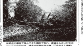
噴石落下「命危険」。霧島市。