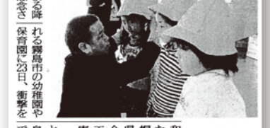
霧島の園児に安全帽。岩手の会社 180個寄贈。霧島市。