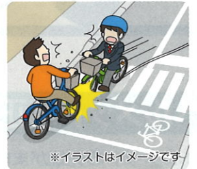
※イラストはイメージです

★昼間、高校生が自転車横断帯のかなり手前から車道を斜め横断し、対向車線の自転車に衝突して、相手に重大な後遺障害を負わせた。