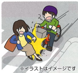
※イラストはイメージです

★夕方、ペットボトルを片手にスピードを落とさないうまま坂を下って交差点に進入、横断歩道を横断中の歩行者に衝突して死亡させた。